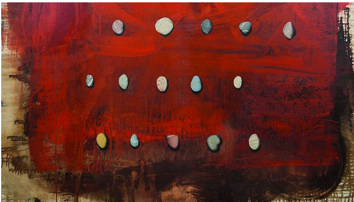
La travesía de Sísifo, obra de Nuria Rodríguez (det

La obra que el artista va a exponer se titula " Sujetos " y es una escultura de pared producida a finales de 2015 que continúa una investigación plástica de Schweitzer sobre el cuerpo y el espacio. Él la concibe como una obra de tránsito, en la que pasa de propuestas más antropomórficas a otras donde el espacio cobra protagonismo. Entiende el espacio como algo plástico, es decir, algo que se puede "modelar", dar forma, siempre con el cuerpo como eje que lo articula. Para ello se sirve de la línea y la geometría y el resultado se traduce en obras muy espaciales que "crean espacio".